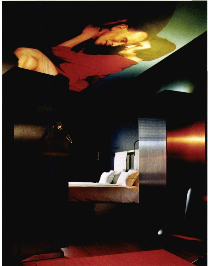
Liebingsfilmszenen des Architekten Jean Nouvel an den Zimmerdecken. Jedes Zimmer im «The Hotel» bietet eine andere Szene an der Decke.

Der französische Star-Architekt Jean Nouvel bescherte Luzern zwei Meisterwerke. Er baute das Kunst- und Kongresszentrum (KKL), dessen Flachdach mutig die Seepromenade überragt und rasch zu einem Wahrzeichen der Stadt avancierte. Ein Jahr später nahm er den Auftrag für ein Design-Hotel ganz in der Nähe an und schuf ein Haus von unverwechselbarer Magie. Im April 2000 wurde «The Hotel» eröffnet. Das Resultat war ebenso verblüffend wie aufregend: Der puristische Chic des Hotels im Herzen von Luzern setzte über Nacht internationale Massstäbe. «The Hotel» versprüht Lebensfreude, es öffnet ein Fenster für die Welt von übermorgen und ist dem Zeitgeist immer eine Spur voraus», freut sich Hotelier Karli. Vom Magazin Condé Nast Traveller wurde «The Hotel» zu den «25 coolest new hotels in the world» gewählt. Star-Designer Matteo Thun: «Lieblingsfilmszenen des Architekten Jean Nouvel an den Zimmerdecken, darauf abgestimmtes Interieur, hervorragendes Personal und fantastische Küche! Beim ersten Besuch erwischte ich meine Frau, wie sie Spiegel, Waschtisch und die Abstände zwischen den Badezimmerlampen ausmass und bewundernd sagte: «Hier stimmt alles!»